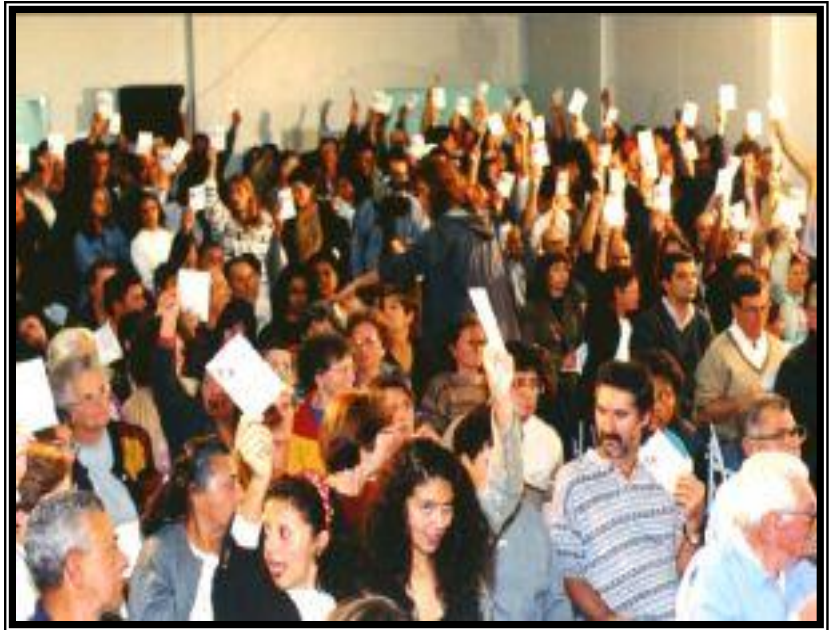
Porto Alegre, Brésil